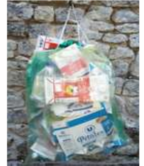
après pliage : plus qu'1 sac