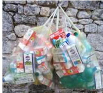
Avant pliage : 2 sacs