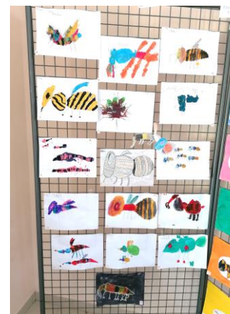
Quelques chefs d'œuvres de nos artistes en herbe