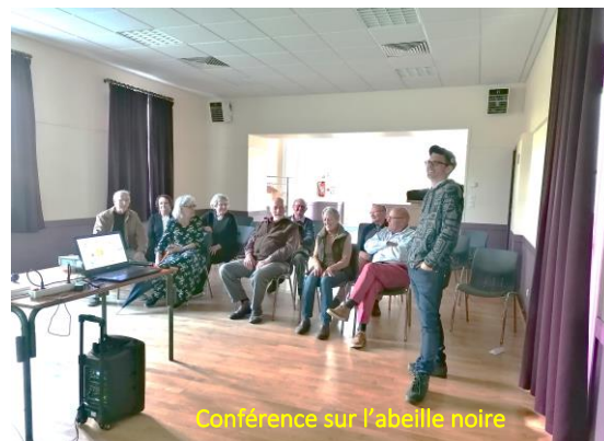
Conférence sur l'abeille noire