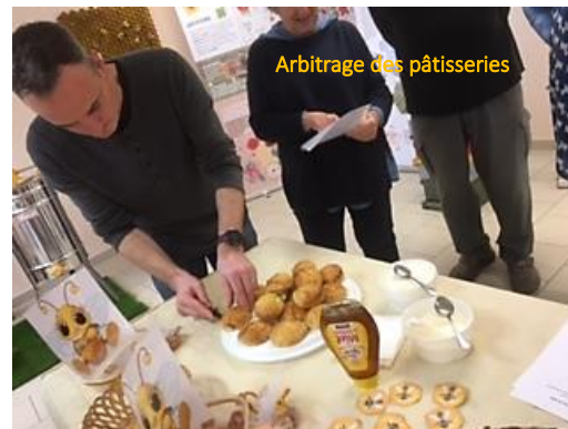
Arbitrage des pâtisseries