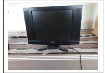
Télévision marque. Funai - Écran 51 cm Dimensions extérieures Hauteur sur socle: 47 cm, largeur 59 cm.