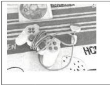
1 console de jeu

Contactez la mairie au 02 47 95 70 36 avant le 31 juillet