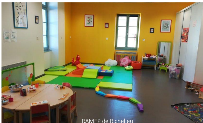
RAMEP de Richelieu