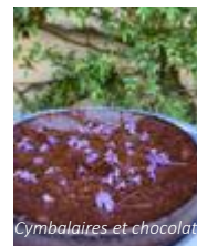
Cymbalaires et chocolat

Cet été, le Château du Rivau organise dans les jardins aromatiques des visites ateliers Herboristerie où l'on pourra apprendre à composer des tisanes ou des boissons rafraîchissantes avec les plantes du jardin des fleurs comestibles.