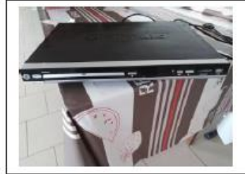
Lecteur DVD marque Ripping, 36X25