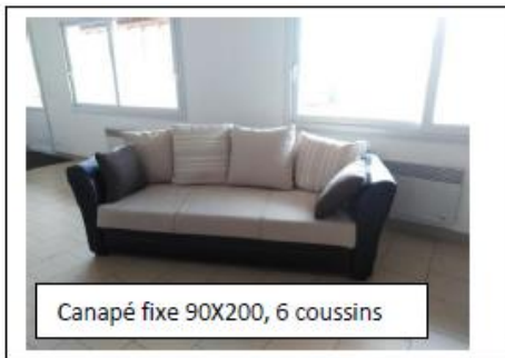
Canapé fixe 90X200, 6 coussins