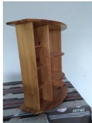
Meuble hi-fi pin: hauteur 70 cm, largeur 70 cm, profondeur maxi 35 cm.