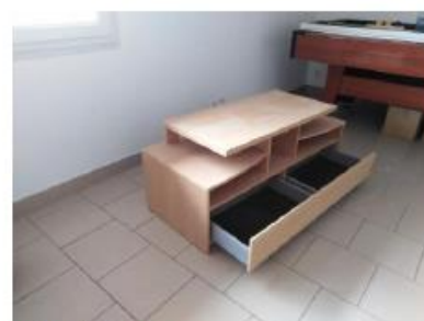
Meuble TV pin avec tiroir - 123X51